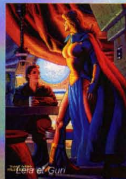
Leia et Guri.