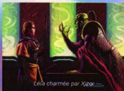
Leia charmée par Xizor.