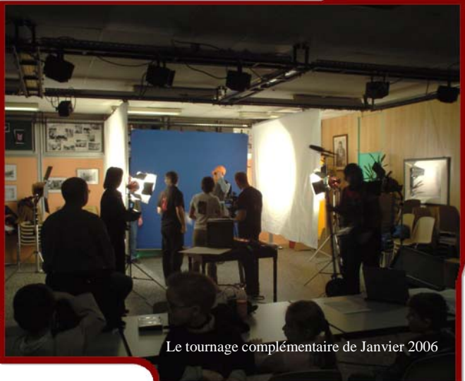
Le tournage complémentaire de Janvier 2006

De temps à autre vous aurez peut-être même droit à 2 pages en plus sur un autre sujet. Alors, avis aux rédacteurs en herbes. Si vous souhaitez collaborer à la rédaction de la double page