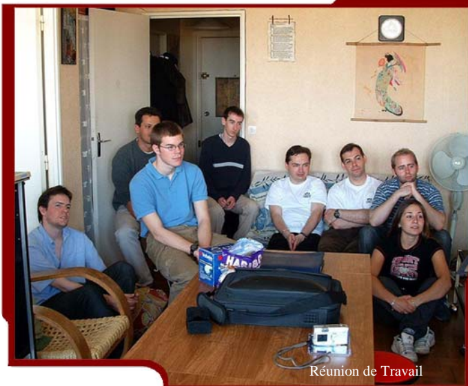
Réunion de Travail

Encore merci de la confiance que vous nous témoignez et de la patience dont vous faites preuve. J'espère que le Fanfilm L'ORDRE SITH, sera à la hauteur de vos attentes (il y aura probablement de gros « manques », mais, soyez-en sûr vous aurez aussi droit à des scènes de qualité. Je n'en doute pas, suite aux previews que j'ai régulièrement l'occasion de voir...)