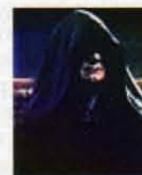
Le sénateur Dark Sidious L'empereur Une seule et même personne : PALPATINE